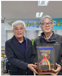
A조 우승자와 사우회장/B조우승자와 바둑동호회장