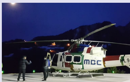
야간촬영을 준비중인 MBC 헬기

방송용 동일 기종으로 세계에서 5대밖에 없다는 MBC 헬기 촬영감독이었던 나는 그 헬기를 타고 19년간 하늘을 날고 있었다. 회전 날개의 진동이 내 척추를 흔들 때 나는 100m 상공에서 지상의 거의 모든 사건과 현장을 조감(鳥瞰)한 영상을 중계했다. 강을 보려면 산으로 올라가야 하고, 산을 보려면 강으로 내려와야 하듯이 세상의 맥을 짚기 위해서 인간 세상을 굽어봤다.