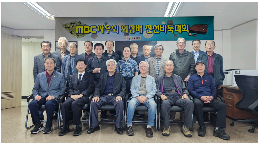
바둑대회 참가자 기념촬영

이기고 지는 것이 중요하지 않았다. 한 수를 두고 웃고, 눈빛이 오고가면 마주 앉은 상대는 다시 동료가 되었다. 이번 대회는 바둑의 정신, 곧 AI로 대체할 수 없는, 사람과 사람을 잇는 그 묘한 끈이 여전히 살아있음을 보여주고 서로 격려의 박수를 쳐 주는 가운데 막을 내렸다.