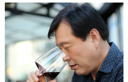
와인, 인문학의 잔을 채우다