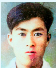
복원한 아버님 사진