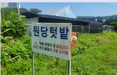
고양시의 21개의 농장중 대표적인 원당텃밭

사우들이 켈 감자밭은 길이 10m쯤 되는 이랑 두 줄. 미리 감자 줄기를 걷어낸 상태여서 이마를 드러낸 감자도 보인다. 회원들은 각자 편한 자세를 취했는데 어떤 이는 쭈그린 자세로, 어떤 이는 ‘둥글고 빨간 엉덩이 방식’을 깔고 앉았다. 호미로 흙을 뒤적이다 굵은 감자가 나오면 “아이쿠 이놈 봐라, 손바닥만 해”라고 환호성이다. 다른 회원들은 고개를 내밀어 소리 나는 쪽을 본다.