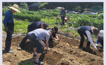
피약별을 이겨낸 은빛 머리칼

몇몇 회원들이 외바퀴 손수레를 밀고 다니며 감자 줄기를 치우고, 수확한 감자를 텃밭 정자(亭子) 앞에 모아 놓았다. 밭에서 감자 캐기에 진력이 날 때쯤 회원들은 옛 추억을 쏟아냈다.