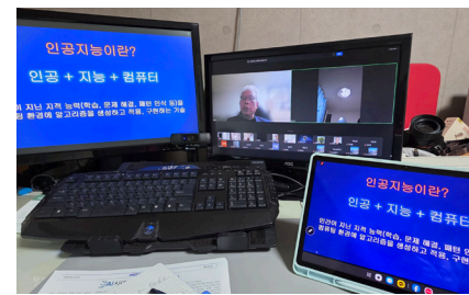
온라인으로 진행된 2차 AI교육