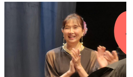
음악극 ‘조선협객’에서 기생 옥란역

그녀의 정식 직함은 ‘프리랜서 배우 겸 영상감독’. 인공지능이 대체할 수 없는 인간의 감성과 통찰력이 있어야 하는 고된 일인지 모른다. 하지만 그녀가 진정 좋아하고 재미가 있어서 선택한 인생 최고의 일이다. 다양한 개성을 가진 사람의 삶을 연기함으로써 얻는 인생의 깊이와 통찰력 때문일까? 이목구비 또렷한 미모의 얼굴에서 난향(蘭香) 같은 여배우의 아우라가 은은하다.