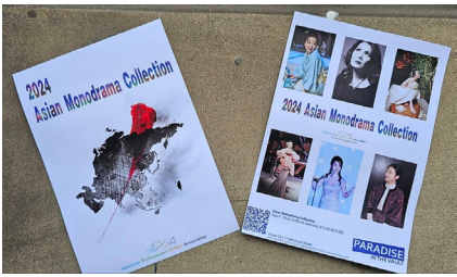
‘아시아 모노드라마 컬렉션’에서 단독공연

2019년 영상 스토리텔링 수업에서 다룬 ‘빅히트엔터테인먼트(현 하이브)’의 BTS 방탄소년단의 다양한 영상들을 연구하면서 갑자기 마음에 들어온 노래 가사가 있었는데 “네가 진짜로 원하는 게 뭐야?”였다. 그 가사를 들을 때마다 ‘정말 내가 원하는 게 뭘까?’ 하고 곰곰이 생각해 보니, 대학 3학년 때 영어연극을 하면서 느꼈던 뿌듯함이 화살처럼 가슴에 꽂히는 거였다. “내 마음을 뛰게 했던 거, 그게 진짜 내가 원하는 거잖아?” 하고 망설임없이 그녀는 배우가 되기로 했다. 1년간 연기수업반이 있는 시니어 모델 학원에 다니며 연기 공부와 함께 패션, 뷰티에 관심을 기울이면서 새로운 분야에 흥미가 일기 시작했다.