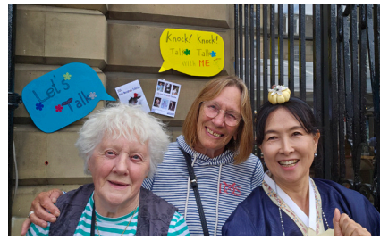
‘에든버러 페스티벌 프린지’에서

이곳에서 처음으로 연극무대에 올랐다. ‘강봉식/이필레 부부가 30대부터 70대까지 소시민으로 살아가는’ 휴먼 코미디 ‘당신만이’. 여기서 30대 필레역을 맡았다. 이어서, 또 다른 곳에서 연기 워크숍에 참여하며 연기 공부를 하던 중 대학로에서 처음으로 상업연극 ‘베키샤’에 캐스팅이 되었다. 우아하고 고집스러운 엄마인 수잔 역할이었다.