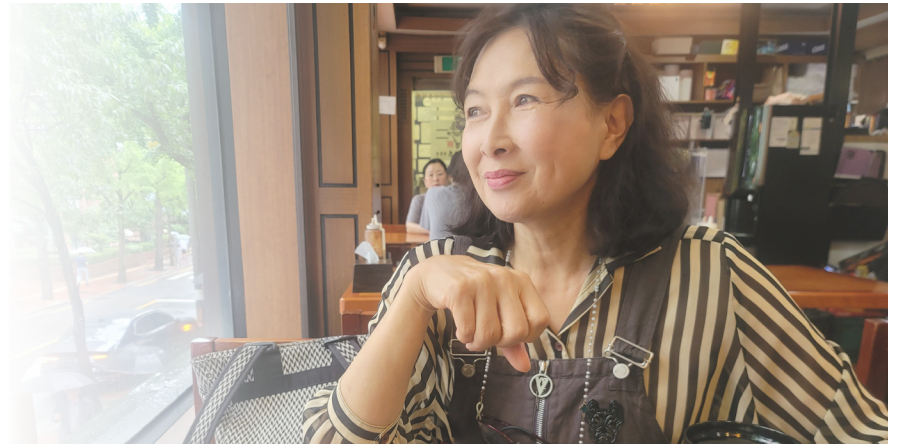
희망퇴직을 했지요. 그때가 코로나가 시작되기 직전인 2020년 2월이었습니다” (2면에 계속)

교수로 재직하면서 정년 퇴임 65세라는 나이를 생각할 때, 그 이후의 삶은 어떻게 살아야 할까? 늘 생각했습니다. 학교를 둘러싼 환경이 변하고 학생들 역시 예전과 다른 분위기 속에서 2019년 희망퇴직자를 구하는 공고가 났습니다. 60세가 되기 전 새로운 일에 대한 토대를 다져야 하겠다는 생각에