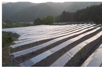
흙 속 미생물이 살아있는 생태포도밭

그램 제작으로 인한 스트레스가 원인이었다. 아내는 그의 건강을 위해 주말 만이라도 전원생활을 하자며 무리를 해서 지금의 땅 2천 평을 은행 용자를 얻어 매입했다.