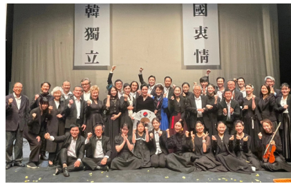
독립예술영화 ‘계단 너머 집, 출연진과

이 밖에도 독립예술영화 ‘계단 너머 집’에서 공양주 보살인 경자 역할을 했고 음악극 ‘조선협객’에서는 기생인 옥란의 역할을 소화했다. “연극이나 독립영화, 광고에 출연하고 나면 늘 다음에 더 잘하고 싶다”는 그녀는 자신의 유튜브 ‘오늘, 바람처럼 (@likethewind3773)’에 자신이 만든 영상을 올린다면서 화면을 보여줬다.