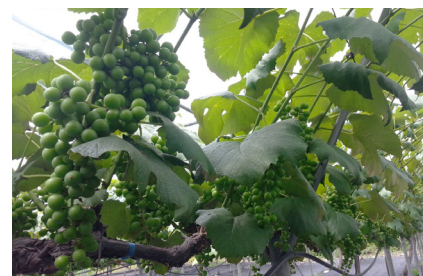
땅심이 살아 천연의 맛과 향을 품은 포도

다행히 무농약 포도 농사를 지은 덕에 일정량은 학교 급식용으로 납품할 수 있었으나 수확량이 한결같지 않은 게 문제였다. 그는 “고백하건대 세상에서 가장 힘든 일이 있다면 아마 장사가 아닐까?” 하였다. 남은 포도는 포도주를 담근다. 보통 3~4백 병(브랜드명 판미동)이 나오는데 팔지는 않고 아는 사람들끼리 나눠 마시거나 선물한다.