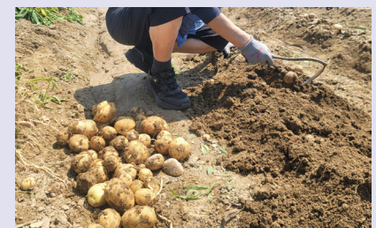
“야, 이거 좀 봐. 크다. 커”