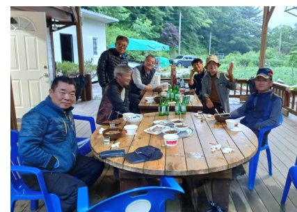
지역 사람들과 함께하는 즐거운 한때

서울 목동 집에 있을 때는 저녁 8시에 자고 새벽 4시에 일어나 스트레칭하고 산에서 얻은 약초 등 8가지를 섞은 채소즙을 마신 다음 1시간씩 산책함으로써 생체 리듬을 유지한다. 은퇴 전보다 훨씬 더 건강해져 여태껏 병원 신세를 지거나 약을 먹은 적이 없다. 끊임없이 몸을 움직였고 마음이 편했던 게 주효했던 것 같다고 말했다.